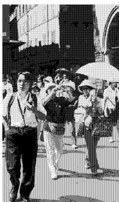
In visita nelle città d'arte dell'Emilia-Romagna come Bologna, gli arrivi sono aumentati del 2,4%, il doppio del dato generale della regione

Mr. Mercanzia Spero si arrivi a una sintesi che non penalizza nessuno