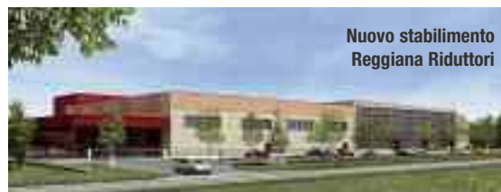
Nuovo stabilimento Reggiana Riduttori