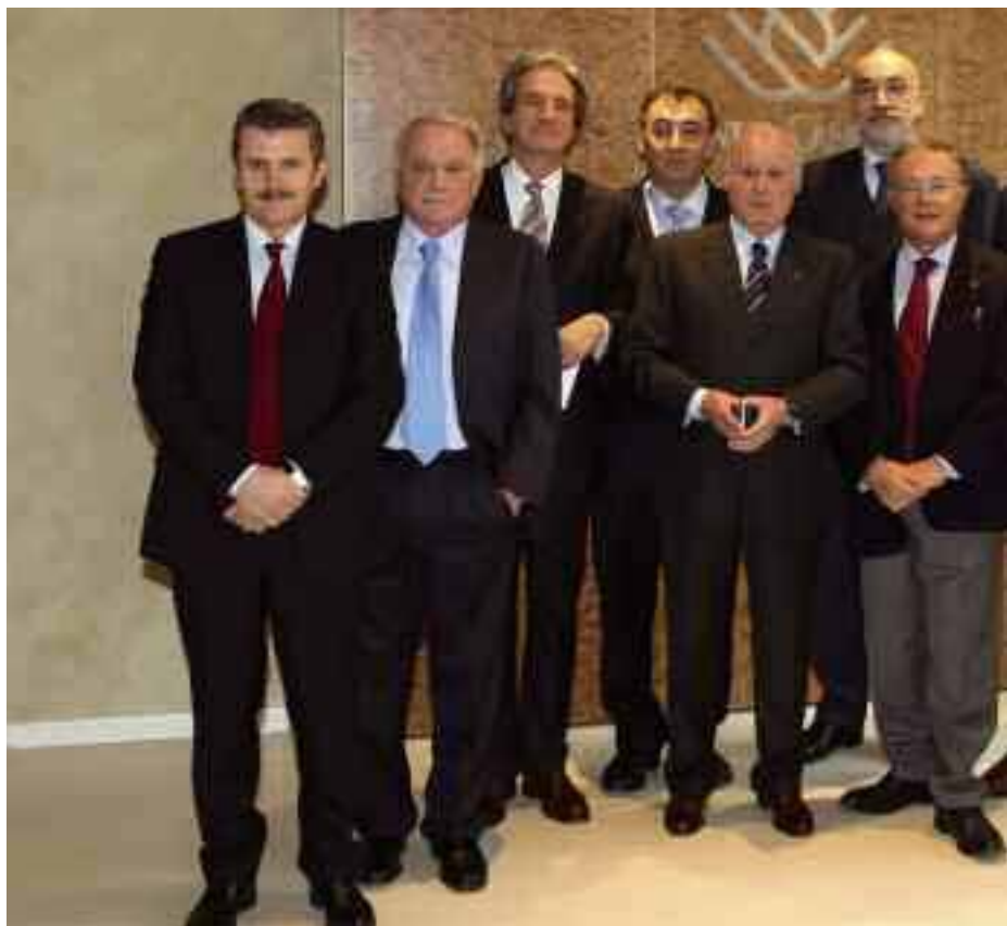
Foto di gruppo dei presidenti camerali dell'Emilia-Romagna alla firma dell'Accordo Quadro

Nove le linee di intervento in cui è articolata l'intesa, di durata triennale