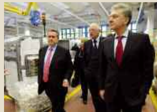
Nella foto, la visita al distretto della meccanica avanzata dell'Emilia-Romagna del Ministro dell'Industria e del Commercio della Federazione Russa Viktor Borisovich Khristenko e del Vice Presidente della Commissione europea Gunter Verheugen con il presidente di Unindustria Bologna Maurizio Marchesini

nell'Unione europea. Oltre a un momento pubblico, sono state visitate alcune realtà dei distretti della meccanica avanzata e della mecatronica: Marchesini Group spa a Bologna, System spa a Fiorano, Comer spa e Club della Meccatronica a Reggio ■