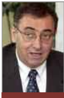
* Presidente Unioncamere Emilia-Romagna

È stato (e sarà) questo il vero valore aggiunto del modello di sviluppo emiliano-romagnolo