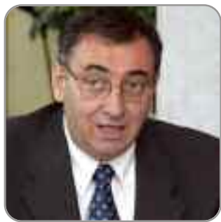
* Presidente Unioncamere Emilia-Romagna

Le imprese continuano a soffrire. Tra le cause, i pagamenti troppo dilatati da parte degli enti pubblici