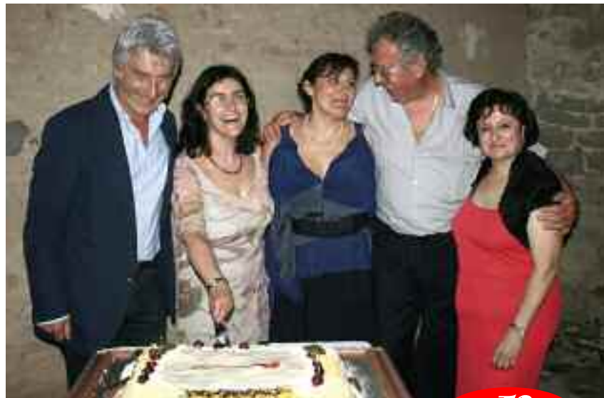
CONSORZIO romagna ALIMENTARE

Il Consorzio Romagna Alimentare fu costituito nel 1980 come struttura polifunzionale con il sostegno degli enti camerali di Ravenna e Forlì, a cui si sarebbe aggiunto Rimini al rico-