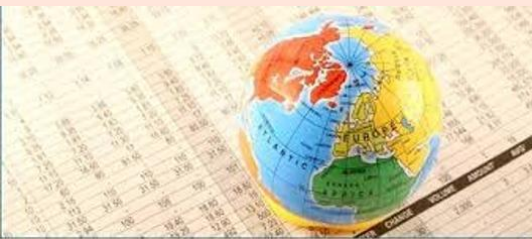
Variazione del PIL anni 2013-2014