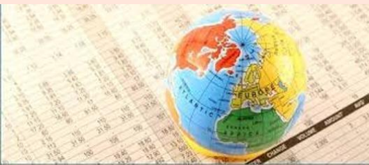
Variation del PIL anni 2013-2014