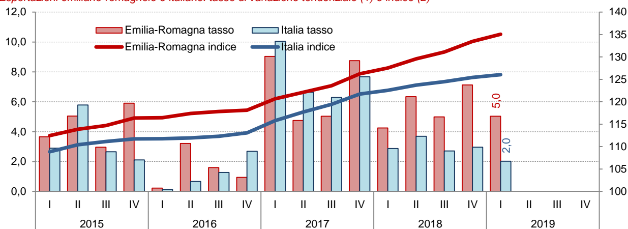
Esportazioni emiliano-romagnole e italiane: tasso di variazione tendenziale (1) e indice (2)

(1) Tasso di variazione sullo stesso trimestre dell'anno precedente (asse sx). (2) Indice: media mobile degli ultimi quattro trimestri, base anno 2008 = 100 a valori correnti (asse dx).