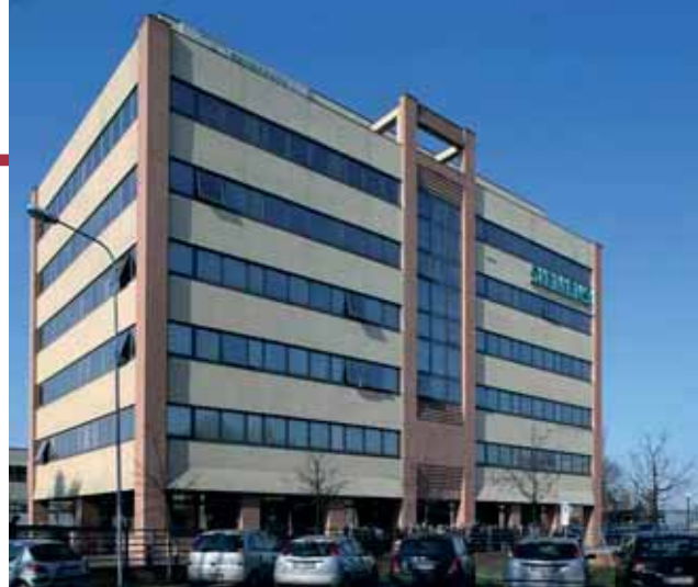
La sede di Confidi Servizi

Positivi, infine, i dati relativi all'attività dei Confidi nella nostra regione. In Italia i Confidi artigiani hanno in essere 11.475 milioni di euro di finanziamenti garantiti e nel 2009 hanno erogato 6.312 milioni di euro di finanziamenti garantiti alle oltre 735 mila imprese socie, di questi il 10,3% erogato in Emilia-Romagna.