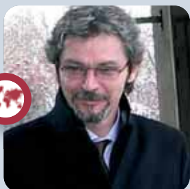
Alfredo Peri, assessore regionale alla Programmazione territoriale

"La principale novità è che si tratta di un accordo biennale, quindi con una portata più lunga. Cerchiamo di dare continuità a una serie di interventi che riguardano sia la parte regolativa che gli investimenti".