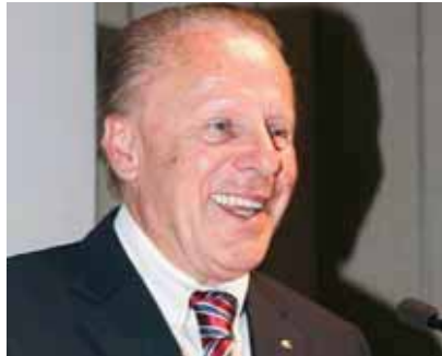
Ferruccio Dardanello presidente di Unioncamere italiana

gliarsi il prezioso ruolo di cerniera tra mercato e istituzioni: “La Convention delle Camere italiane all’estero quest’anno è caduta in un momento cruciale per le attività di internazionalizzazione del ‘sistema Italia’ – conferma il presidente di Unioncamere italiana, Ferruccio Dardanello – è una fase di riordino e di ripartenza, legata alla riforma, delle Camere di commercio italiane, già varata, e degli strumenti per l’internazionalizzazione, attualmente in atto. Il legislatore ha riconosciuto al sistema camerale italiano un carattere unitario, affermando che ne fanno parte, oltre alle 105 Camere italiane, anche le 75 Camere di commercio italiane all’estero e le 35 Camere estere in Italia. Il provvedimento attribuisce specifici compiti di supporto all’internazionalizzazione alle Camere, in raccordo con il ministero dello