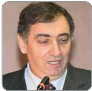
* Presidente Unioncamere Emilia-Romagna

Al fianco delle imprese c'è la rete camerale, sempre più capillare, efficiente, integrata