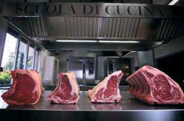
Sopra, da sinistra a destra il confronto tra i vari tipi di mazzatura (o marmorizzazione) della carne bovina. A destra, Wagyuem nel piatto

la che si definisce la marmorizzazione delle carni. In questo modo il grasso si distribuisce all'interno del muscolo anziché restare in superficie. Noi abbiamo cercato di seguire al meglio la tradizione giapponese senza però dimenticare la nostra tradizione che è quella di allevare capi italiani appartenenti al territorio. Tra gli obiettivi del progetto c'è anche la valorizzazione del nostro territorio attraverso l'esportazione. Contiamo di vendere il 20-30% delle carni di Wagyuem tipo Kobe in Italia, e il restante 70-80% all'estero. Oggi tra i maggiori produttori di carne Kobe dopo i giapponesi ci sono gli americani e gli australiani. Su di loro però abbiamo un grande vantaggio: poter esportare in Europa la nostra carne tipo Kobe con l'osso. Dall'estero infatti si può importare solo carne senza osso. Le nostre costate con l'osso invece potranno arrivare sulle tavole di tutti gli europei, dalla Gran Bretagna alla Spagna, dalla Francia alla Germania".