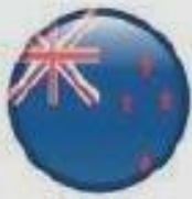
New Zealand Jan 2001