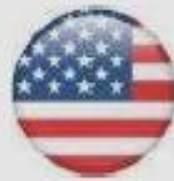
US Jan 2004