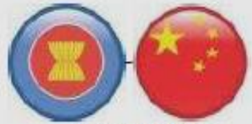
ASEAN-China (TIG) Jul 2005 (TIS) Jul 2007 (Investment) Feb 2010