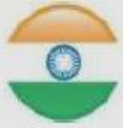
India Aug 2005