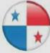
Panama Jul 2006