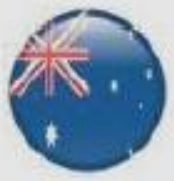
Australia Jul 2003