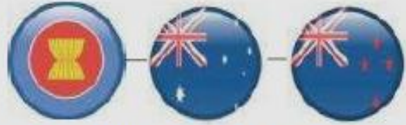
ASEAN-Australia & New Zealand Jan 2010