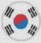
S. Korea Mar 2006