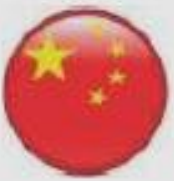
China Jan 2009