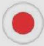
Japan Nov 2002