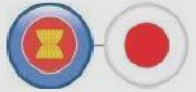
ASEAN-Japan (TIG) Jan 2009