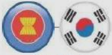
ASEAN-Korea (TIG) Jun 2007 (TIS) May 2009 (Investment) Aug 2009