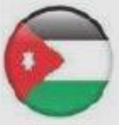
Jordan Aug 2005