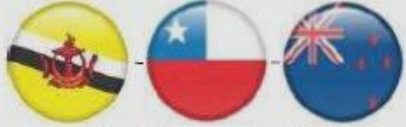
**TPSEP - Brunei, Chile, New Zealand May 2006