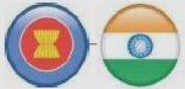
ASEAN-India (TIG) Jan 2010