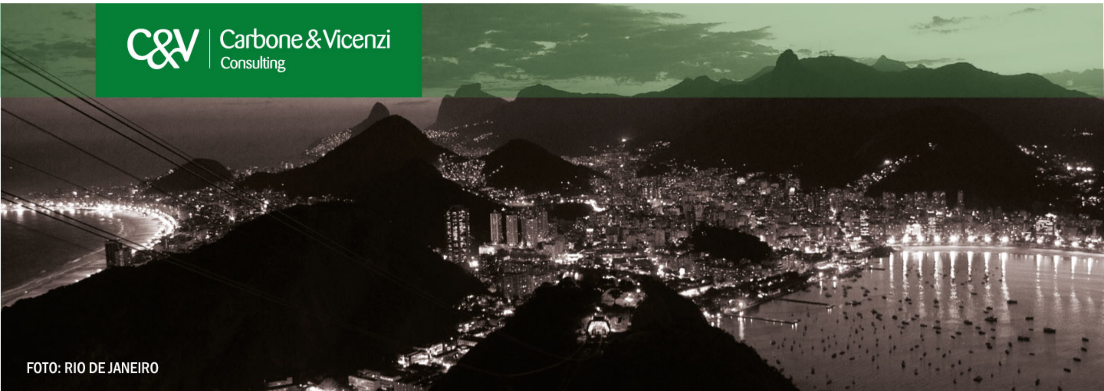
FOTO: RIO DE JANEIRO

ROMA – RIO DE JANEIRO – BRASILIA – RECIFE – JOÃO PESSOA – PORTO ALEGRE – CAXIAS DO SUL – LUANDA